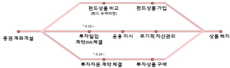
< 증권사 비대면 업무처리 프로세스 >